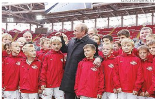
COPA 2018 O presidente russo Vladimir Putin inaugurou a Arena Otkyritie, em Moscou, um dos palcos da Copa 2018. O estádio, que pertence ao Spartak, custou US$ 415 milhões (R$ 935 milhões).